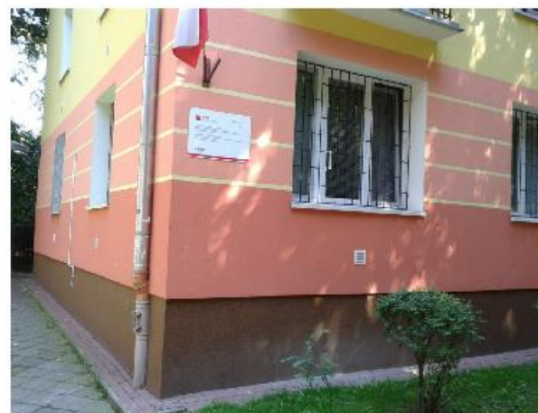
Tablica pamiątkowa o wymiarach (70 cm x 50 cm) zawieszana na budynkach, w których wybudowane zostały węzły indywidualne na okres 5 lat po zakończeniu prac.