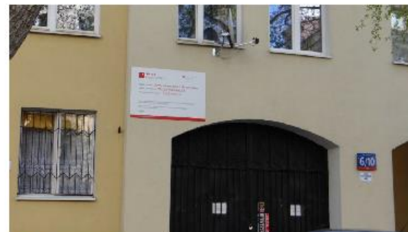
Tablica informacyjna o wymiarach (150 cm x 100 cm) zawieszana w okresie prowadzenia prac, tylko na budynkach, w których znajdują się węzły grupowe.